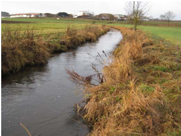
Tirschenreuther Waldnaab bei Liebenstein

Tirschenreuther Waldnaab, unterhalb Speicher Liebenstein bis Tirschenreuth