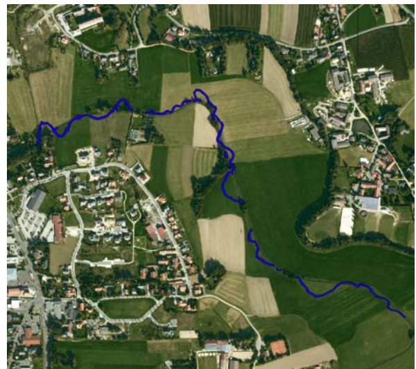
Ökologischer Ausbau der Tirschenreuther Waldnaab in Tirschenreuth 2012