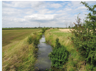
Gewässer mit Gewässerrandstreifen